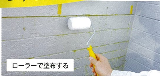
ローラーで塗布する