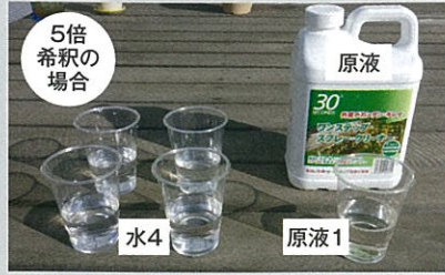
▲専用クリーナーと水