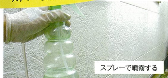
スプレーで噴霧する